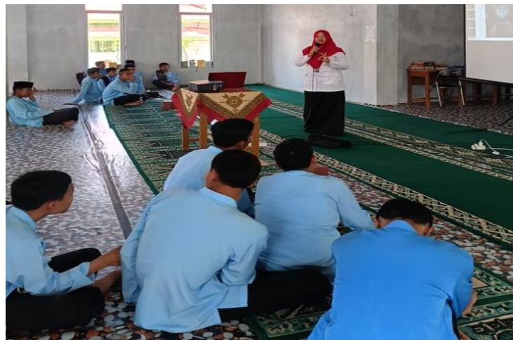
Gambar 5. Penyampaian Materi Oleh Pemateri Kelima