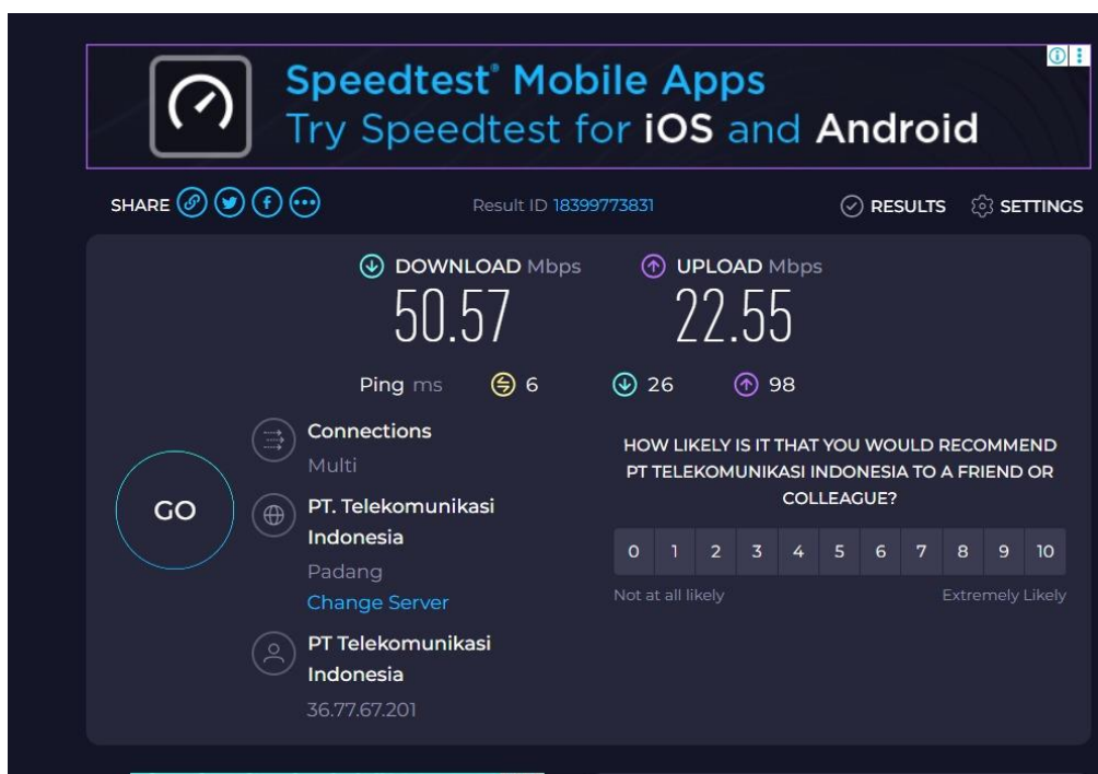
Gambar 2: Kapasitas download dan upload

Setelah perbaikan jaringan, hasil speed test menunjukkan peningkatan kecepatan download dan upload yang signifikan. Kualitas internet ini bisa dilihat pada gambar 2: