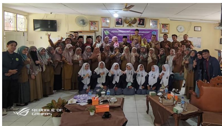
Gambar 4. Foto Bersama setelah Penutupan

Setelah penyajian materi maka diakhiri dengan penutupan dan foto Bersama seperti pada Gambar 4