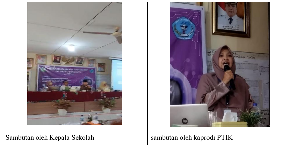
Gambar 1. Pembukaan oleh Kepala sekolah dan Kaprodi PTIK

Pelaksanaan kegiatan PKM ini dilaksanakan pada tanggal 7 Mai 2025 dengan menggunakan Perangkat Chat Gpt sebagai media AI. Kegiatan diawali pembukaan oleh Kepala Sekolah dan wakil dan sambutan oleh Ketua Tim seperti terlihat pada gambar 1.