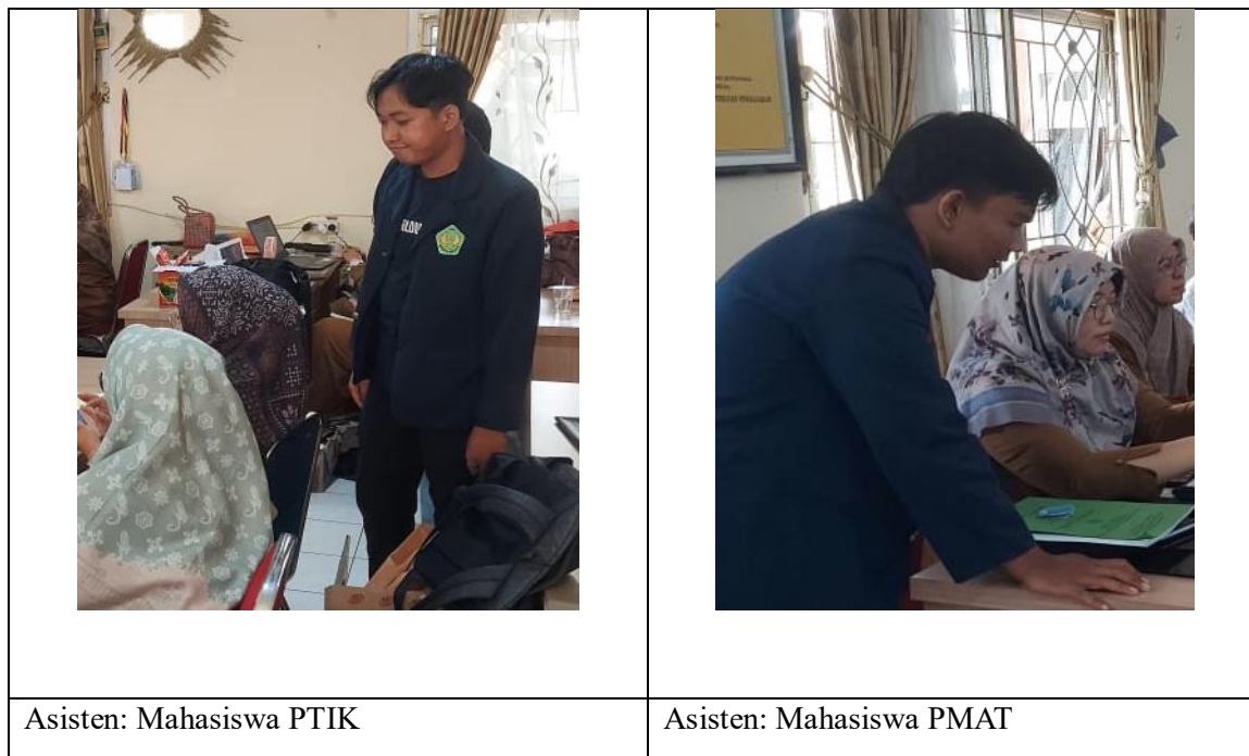
Gambar 3. Asistensi oleh Mahasiswa

Setelah penyajian materi maka diakhiri dengan penutupan dan foto Bersama seperti pada Gambar 4